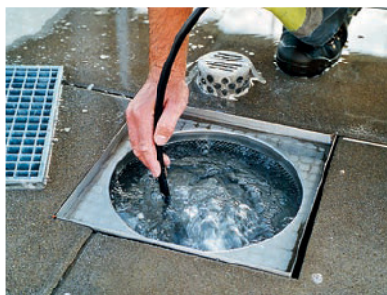
Hochdruckspülung einer verstopften Flachdachentwässerung.

Mögliche Versagensarten sind: Verwurzelungen im Rohr, Korrosion, Rissbildung, unsachgemässe Seitenanschlüsse, undichte Rohrverbindungen, Rohrversatz, Verformung, Wassereintrich.