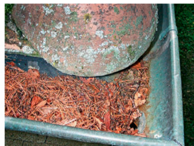
Die periodische Kontrolle und Reinigung von Dachrinnen schützt vor Verstopfungen der Falleitungen durch Laub und Äste.